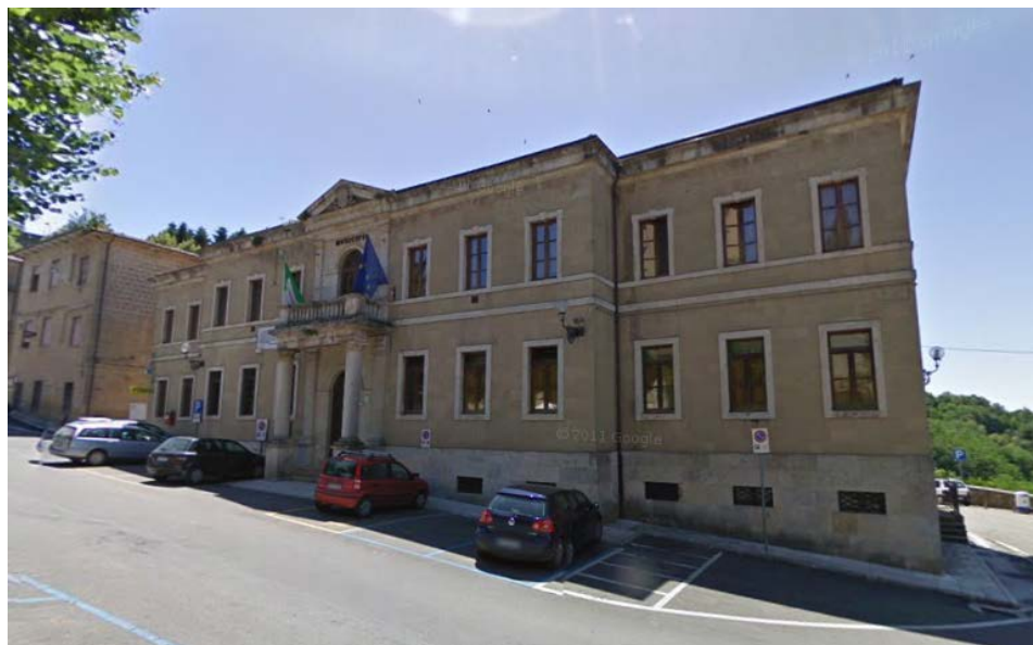
Immagine sede principale