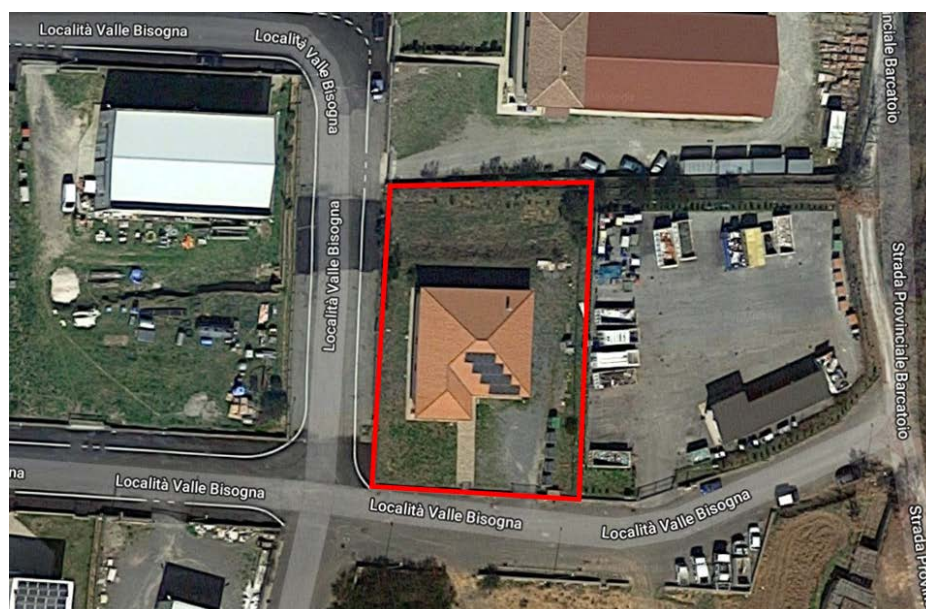
Immagine sede secondaria