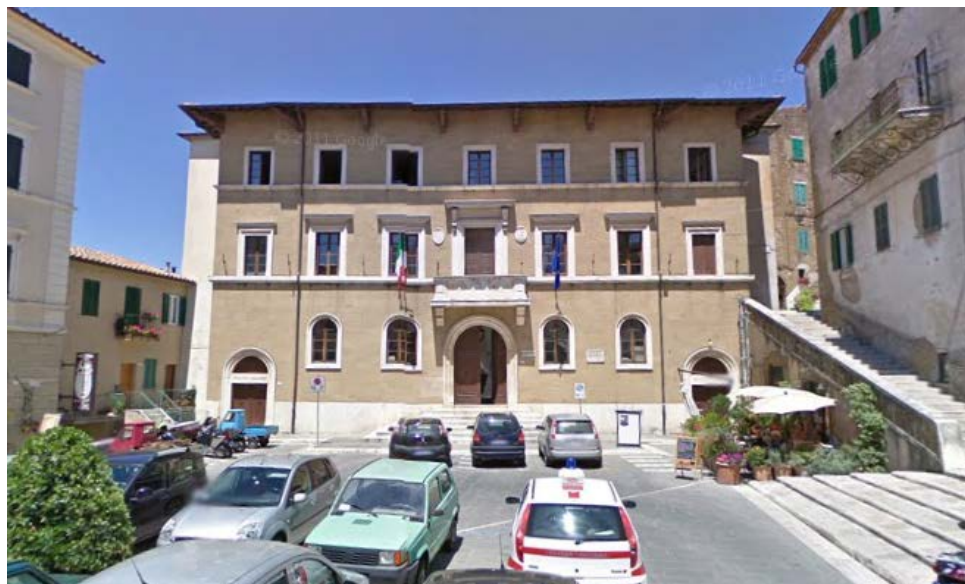
Immagine sede principale